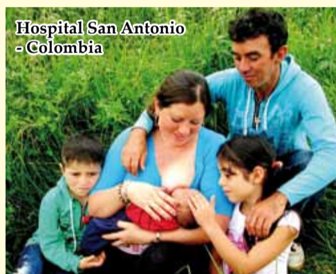
Hospital San Antonio - Colombia